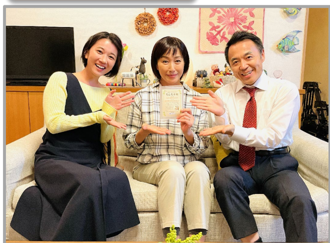
働き盛り世代(壮年期)編 ～みどりの見える街で～ 12:15～12:30