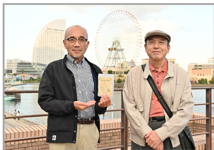
総りの世代(高齢期)編 ～みなとの見える街で～ 13:30～13:45